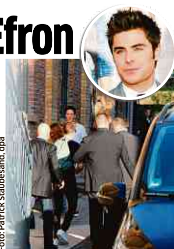
Aus dem Gebäude verschwand Zac Efron (M.) gleich ins Auto.

Greet“-Teilnehmer glücklich Selfies teilten, gingen die geduldigen Fans traurig nach Hause.