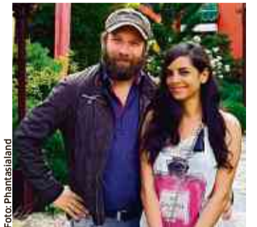
Christian Ulmen und Ehefrau Collien im Phantasialand

Ferienzeit - auch Moderatorinnen und Schauspieler machen frei. Collien Ulmen-Fernandes (35) und ihr Ehemann Christian Ulmen (41) besuchten jetzt mal wieder das Phantasialand. „Es ist über die Jahre zu einem Brauchtum unseres Hauses geworden: Das Zeremoniell des Brühl-Besuchs zum Beginn der Sommerferien wird nicht hinterfragt, das ist wie mit der Kirche an Weihnachten, nur etwas lauter und ehrlicher“, so Christian Ulmen.